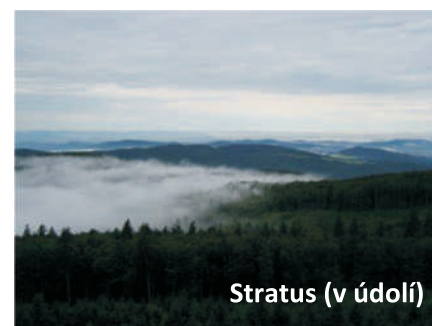
Stratus (v údolí)