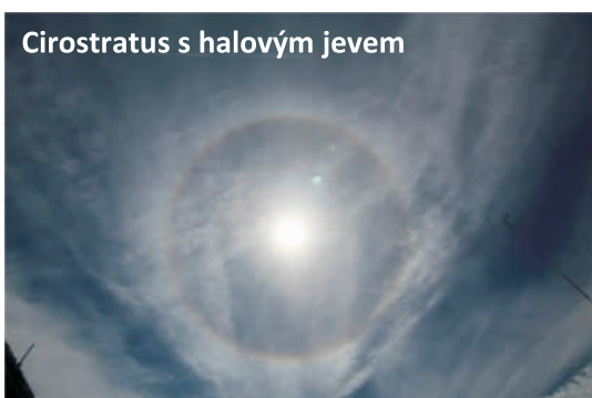
Cirrostratus s halovým jevem